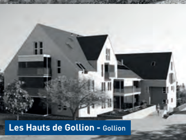
Les Hauts de Gollion - Gollion