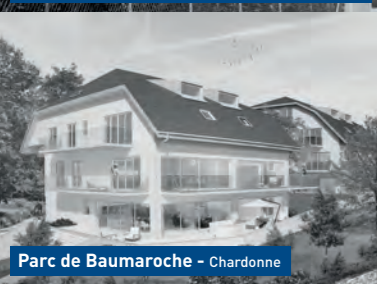
Parc de Baumaroché - Chardonne