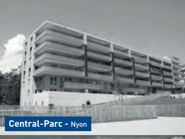
Central-Parc - Nyon