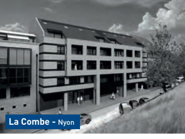
La Combe - Nyon