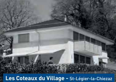
Les Coteaux du Village - St-Légier-la-Chiezaz