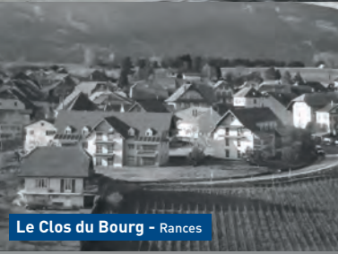
Le Clos du Bourg - Rances